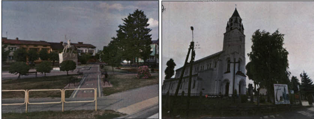
Rysunek 10. Przestrzeń publiczna Chorzel

budowę nowych oraz modernizację istniejących obiektów użyteczności publicznej, w tym obiektów oświatowo-kulturalnych i sportowych”.